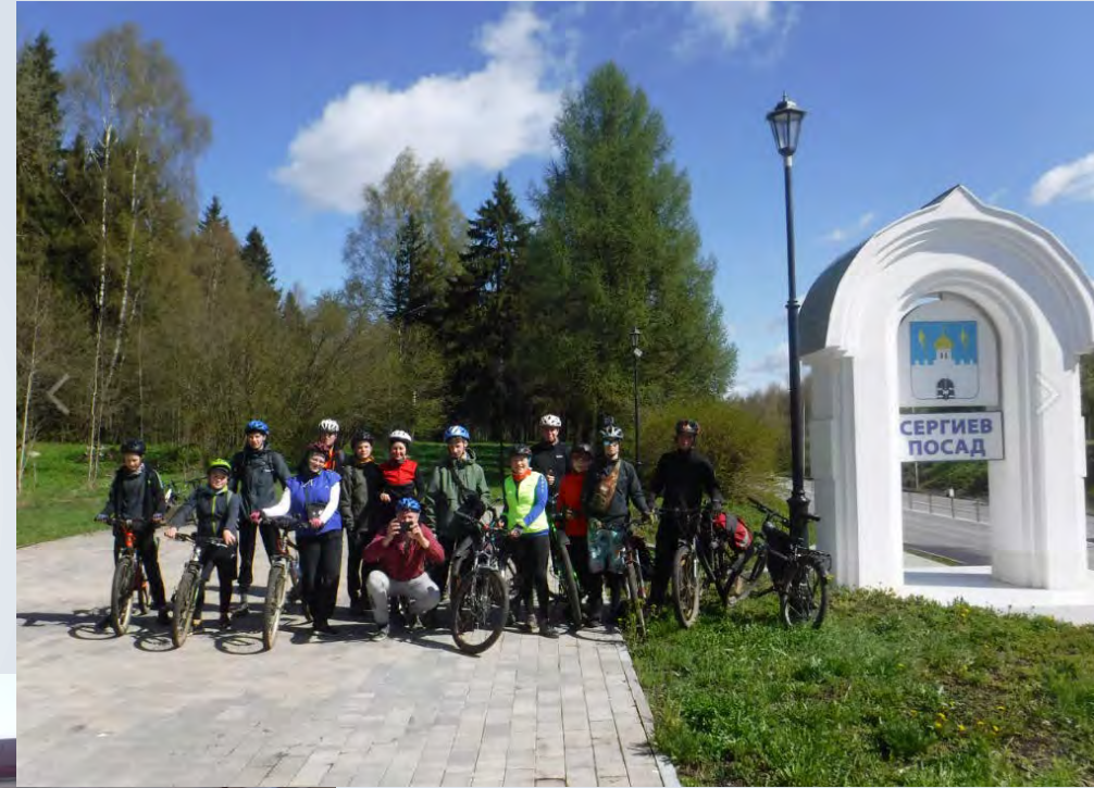
СЕРГИЕВ ПОСАД, 2025