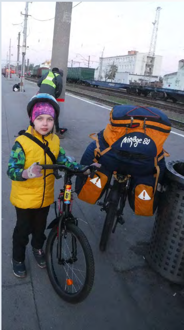
Лиза с папой обошлись одним велорюкзакom на двоих