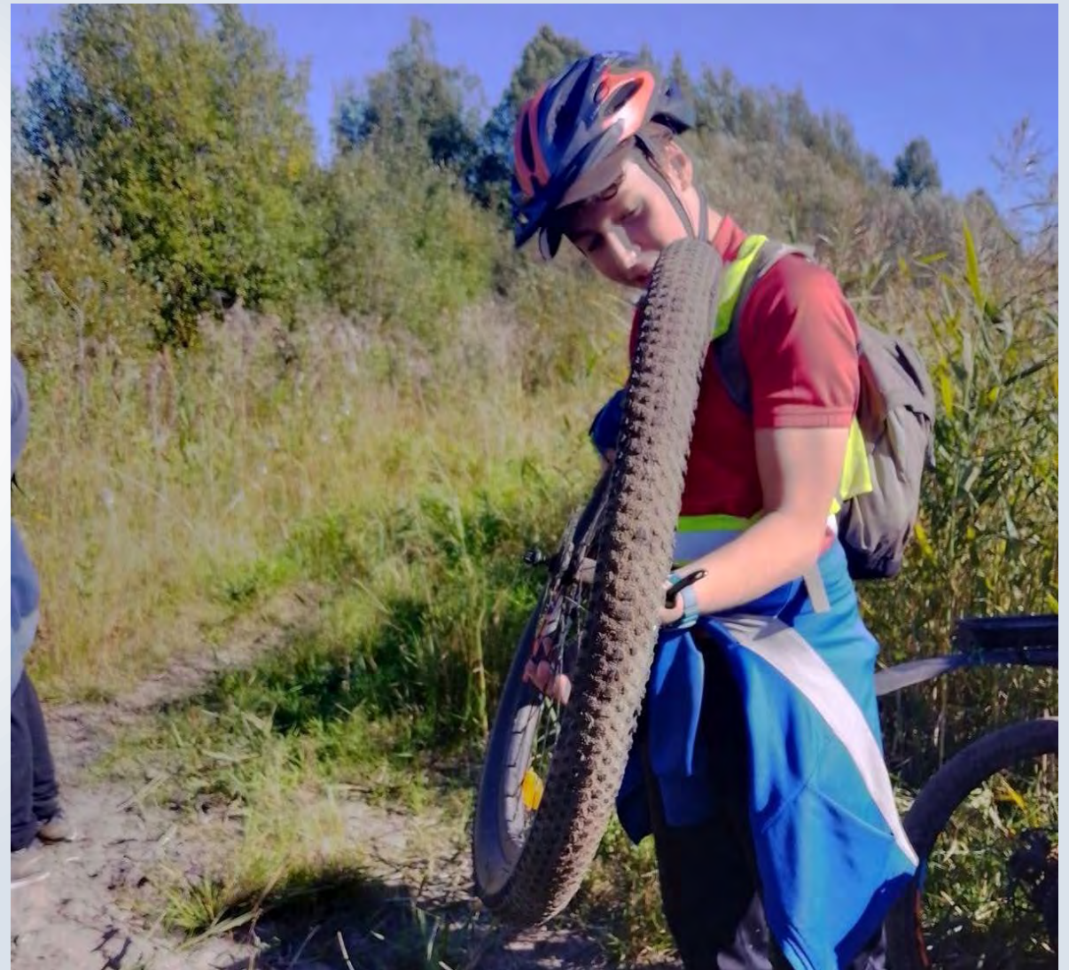
СЫН, 2024 ГОД