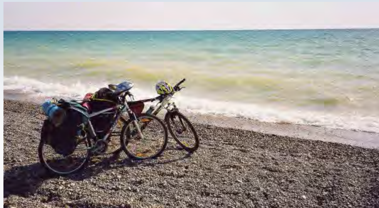
КРЫМ, 2007, 2013 ГОДЫ