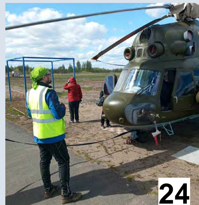
ЛЕВЦОВО Музей малой авиации. Ярославская область