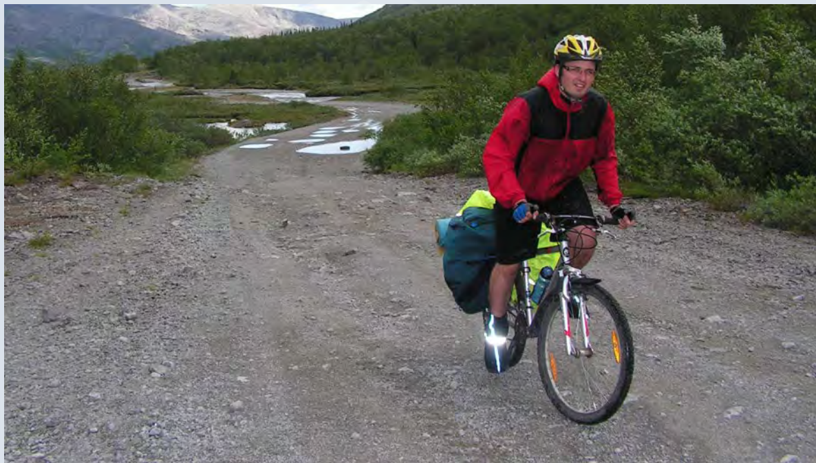
МУРМАНСКАЯ ОБЛАСТЬ, 2010 ГОД