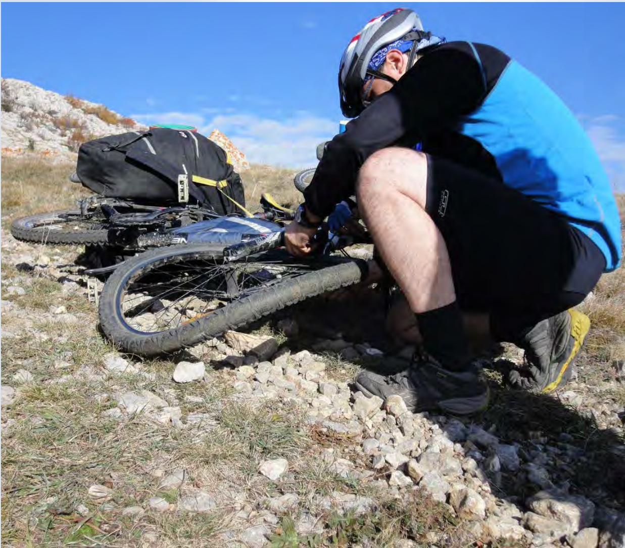
ПАПА, 2013 ГОД